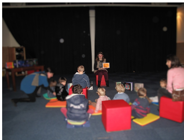
Illustration 2: Photo prise au début de l'animation avant la lecture de l'histoire

Pour être encore plus immergés dans l'histoire, nous avons décidé d'éteindre la lumière pour que tous puissent vraiment suivre l'histoire. Le thème étant la peur du noir, nous espérions qu'aucun enfant n'aurait peur. Ils furent tous, parents et enfants, captivés par l'histoire et les belles illustrations de l'application. A tel point que lorsque l'histoire fut finie, ils applaudirent.