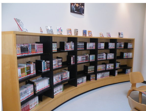
Illustration 19: La salle BD-manga pour adolescents - le côté manga