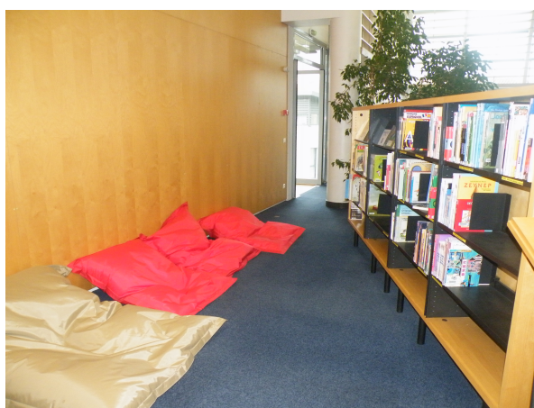
Illustration 18: Le coin de lecture autour des livres en VO (autres langues)