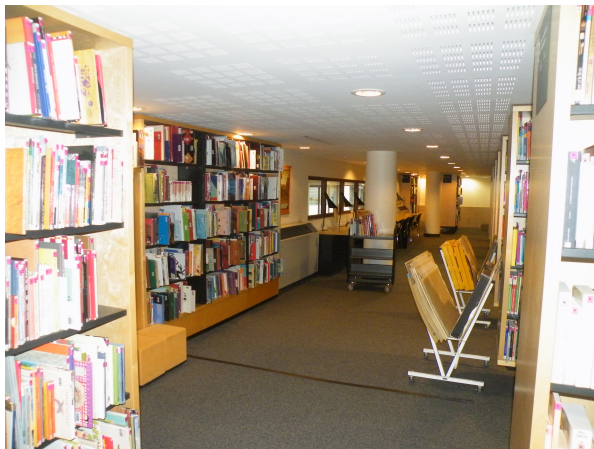
Illustration 25: Les albums prêts collectifs dans le fond