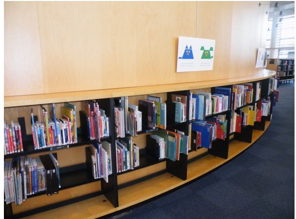
Illustration 10: La suite des fictions 8-12 ans autour de l'oeuf