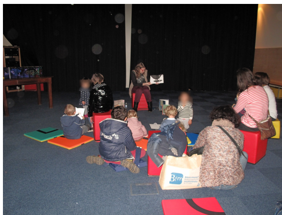
Illustration 28: Lecture de l'album La Nuit de Betty Bone