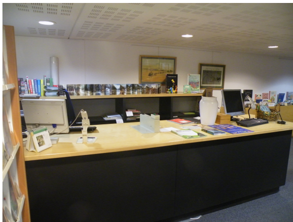
Illustration 23: Banque de renseignement du CRRLJ