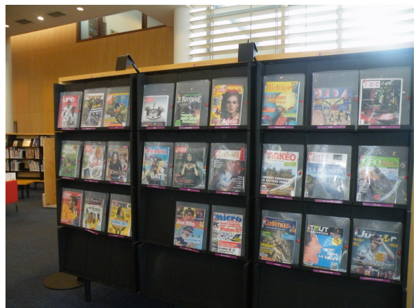
Illustration 14: Les revues pour adolescents