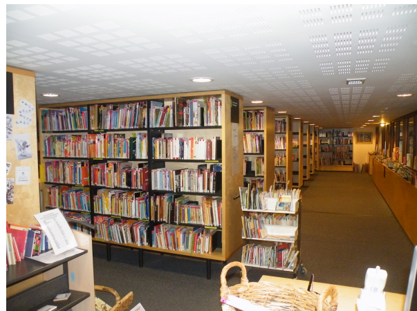
Illustration 24: Les étagères de documentaires et les bacs à albums