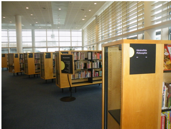
Illustration 11: Le début des documentaires