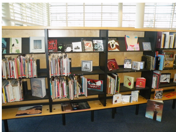
Illustration 15: Les albums pour adolescents