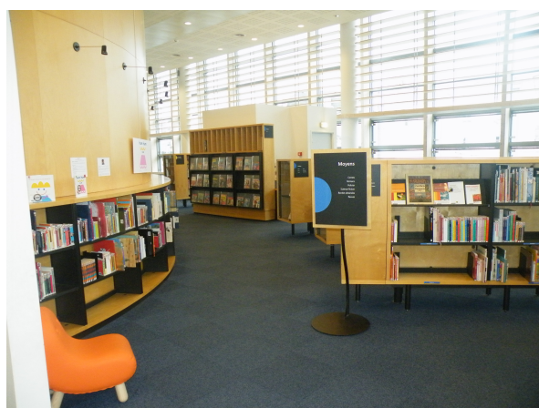
Illustration 8: Les fictions 8-12 ans