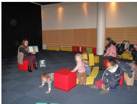
Illustration 30: Lecture de l'album Tu ne dors pas Petit Ours ?