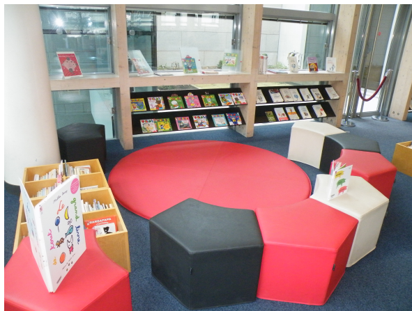
Illustration 4: L'espace petits lecteurs