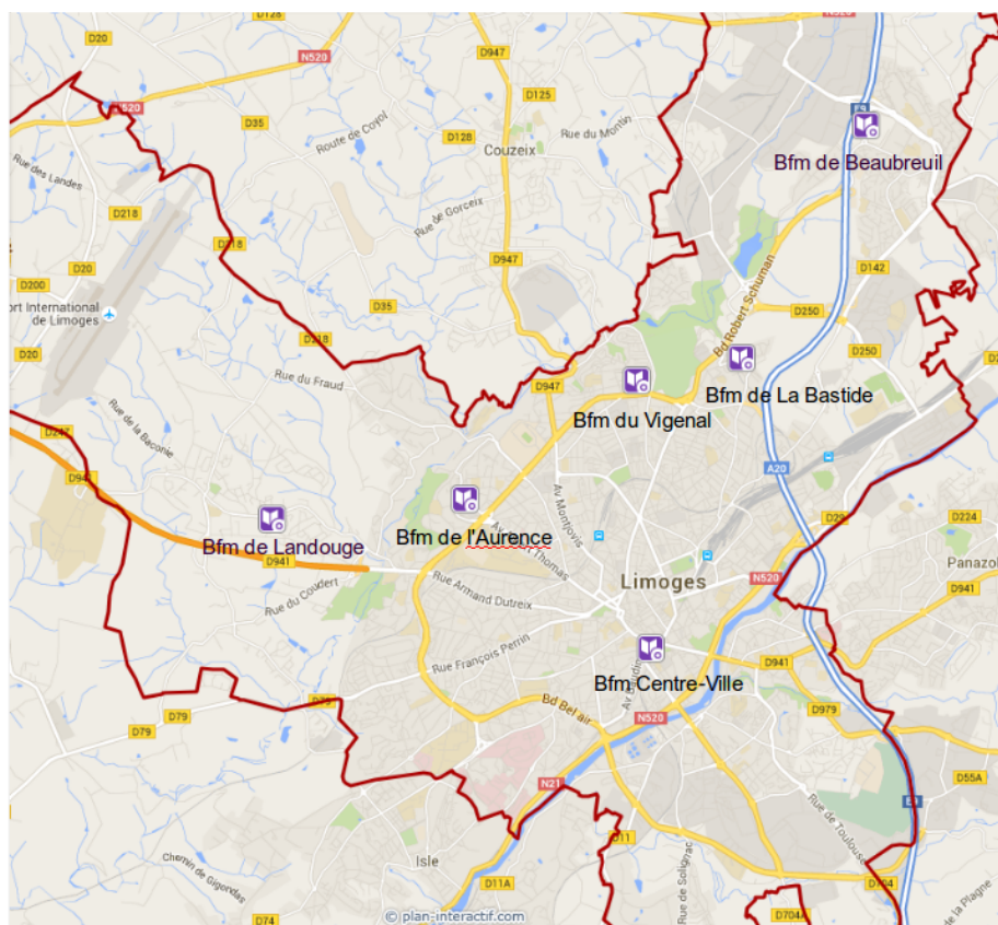
Illustration 1: Plan des bibliothèques de Limoges