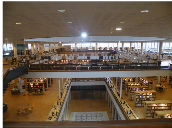
Illustration 26: Vue d'ensemble de la bibliothèque au niveau du CRRLJ