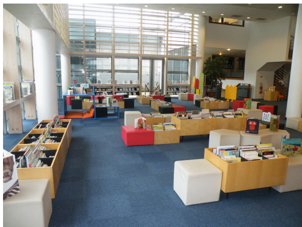
Illustration 5: Le coin des albums