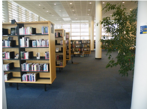
Illustration 22: La sortie/l'entrée du plateau côté adolescent