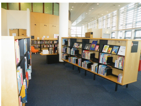
Illustration 7: Les étagères Premières Lectures