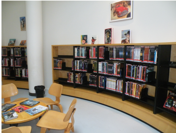
Illustration 21: La salle BD-manga pour adolescents - le coin BD