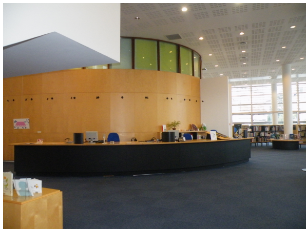
Illustration 3: La banque de renseignement du pôle jeunesse