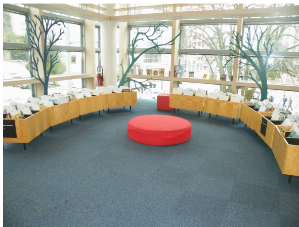
Illustration 6: L'espace BD jeunesse