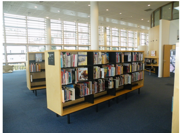
Illustration 12: La fin des documentaires