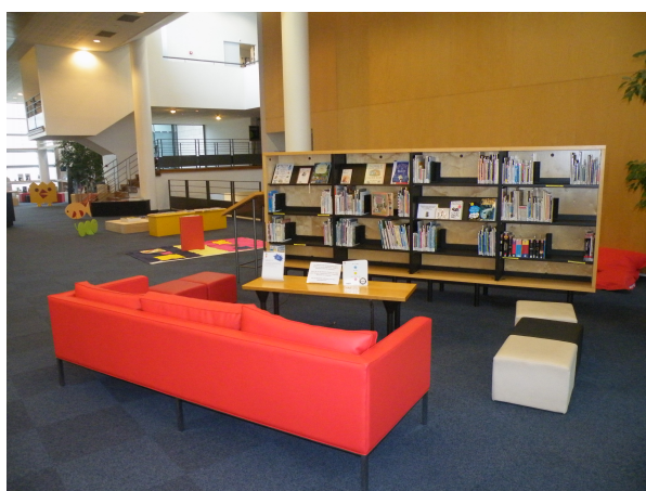
Illustration 17: Le coin de lecture autour des livres en VO (anglais)