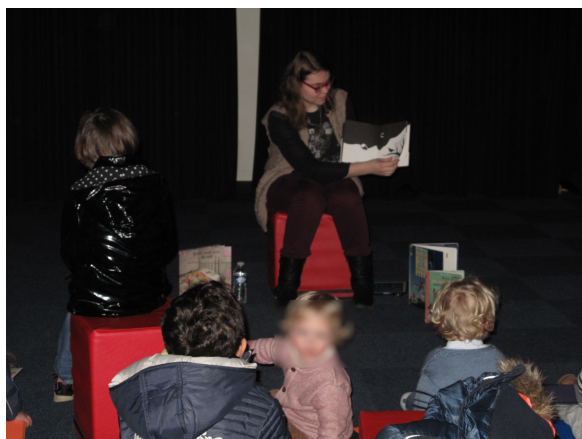
Illustration 27: Lecture de l'album La Nuit de Betty Bone