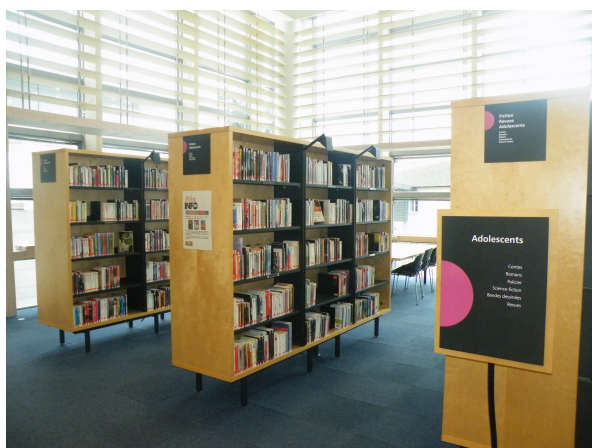
Illustration 16: Les fictions pour adolescents