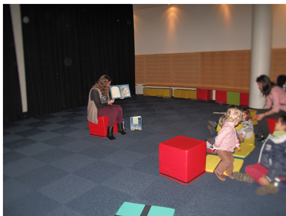
Illustration 29: Lecture de l'album Tu ne dors pas Petit Ours ?