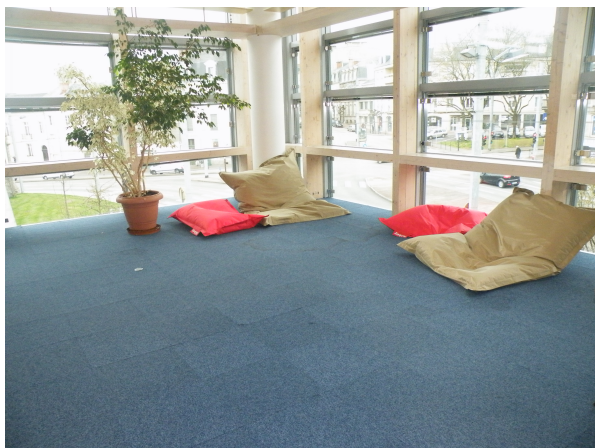
Illustration 13: L'espace détente près des fenêtres