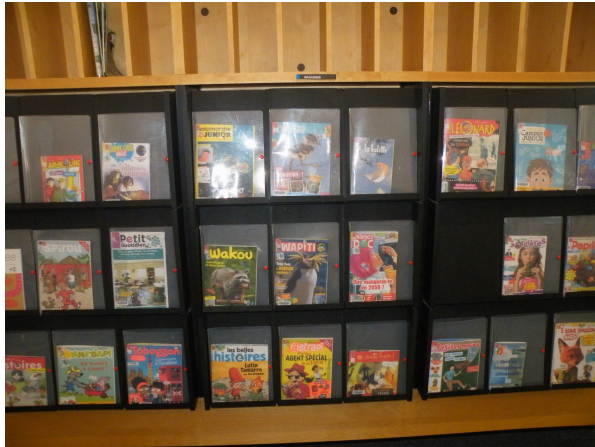
Illustration 9: Les revues pour les juniors