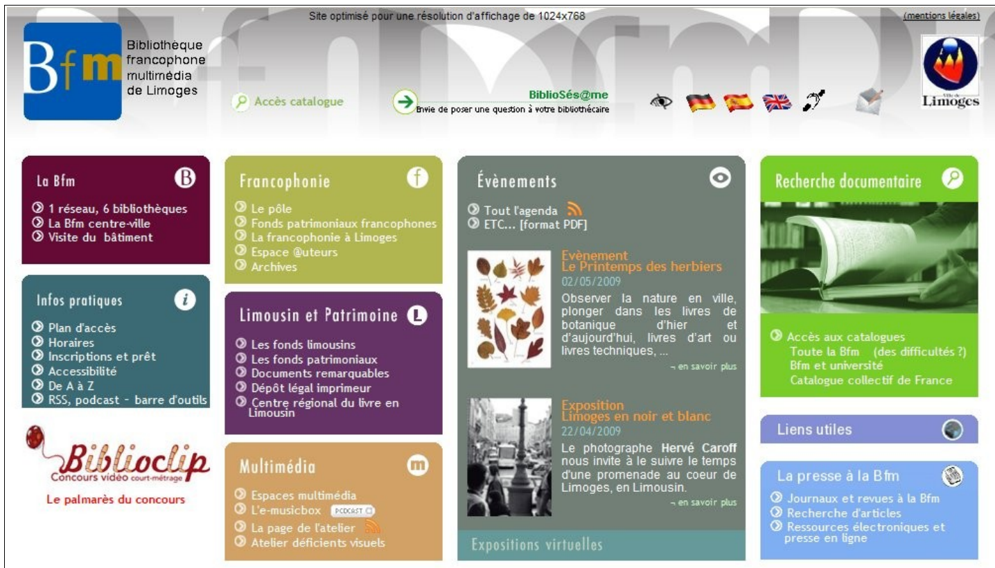
Page d'accueil actuelle du site web de la BFM

L'objectif est de donner des informations sur les ressources disponibles, et qu'elles soient accessibles sans avoir à se déplacer dans la page avec l'ascenseur 13 . Il faut donc maximiser l'espace disponible. Le travail consiste ensuite à définir une arborescence des ressources. A partir de la page d'accueil actuelle du site ci-dessous, j'ai fait quelques essais de présentation.