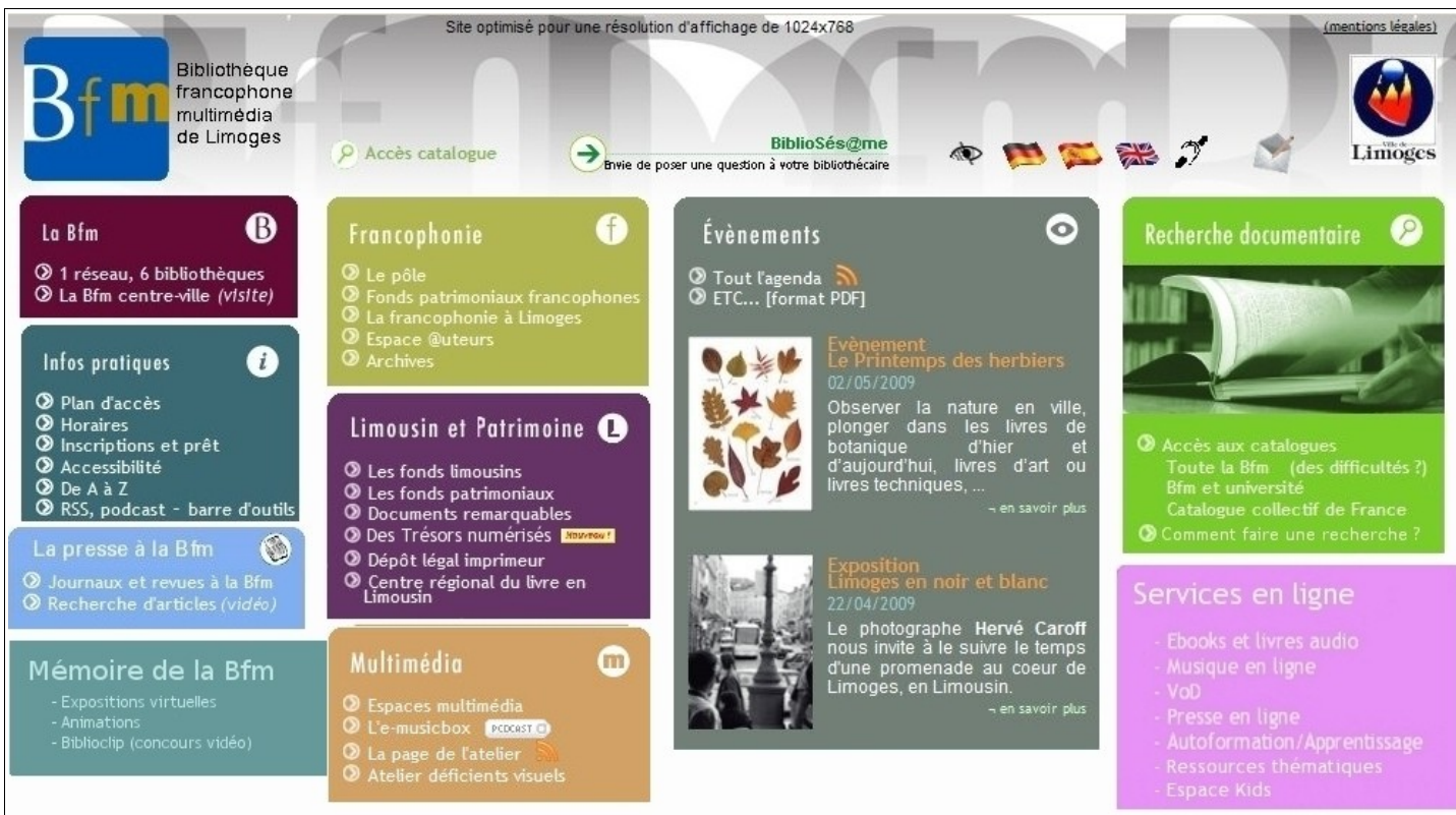
Premier essai de page d'accueil

Dans cet essai, j'ai voulu dissocier les ressources externes, en ajoutant un encart « Services en ligne », et les ressources propres à la BFM, en insérant un encart « Mémoire de la BFM ». Ce dernier contient les expositions virtuelles, les archives de Biblioclip (concours annuel de court-métrage), ainsi que les diverses animations qui se sont déroulées dans la bibliothèque (des conférences, des concerts,...). J'ai supprimé les « Liens utiles », qui peuvent être intégrés dans les « Services en ligne ». Chaque rubrique donnera accès aux ressources payantes et aux gratuites. Quant à l'encart « Limousin et patrimoine », j'ai ajouté une ligne « Trésors numérisés ». Le lien permettra d'accéder aux fonds numérisés. J'y ai également mis un symbole visuel pour signaler qu'il s'agit d'une nouveauté. J'ai ensuite raccourci l'encart « Presse à la BFM », en insérant les « ressources électroniques et presse en ligne » dans les « Services en ligne ».