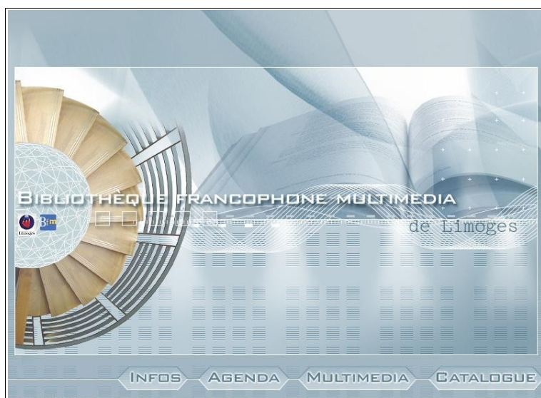
Page d'accueil d'un OPAC multimédia

Tous les espaces de la BFM centre-ville, ainsi que ses bibliothèques de quartier, disposent de postes informatiques. Il existe actuellement deux sortes d'OPAC : des OPAC « classique » (20), permettant juste de faire des recherches dans le catalogue, et des OPAC multimédia (37), identiques, mais qui proposent en plus des ressources en ligne (CD-ROM, sélection de sites internet) via un onglet « Multimédia.