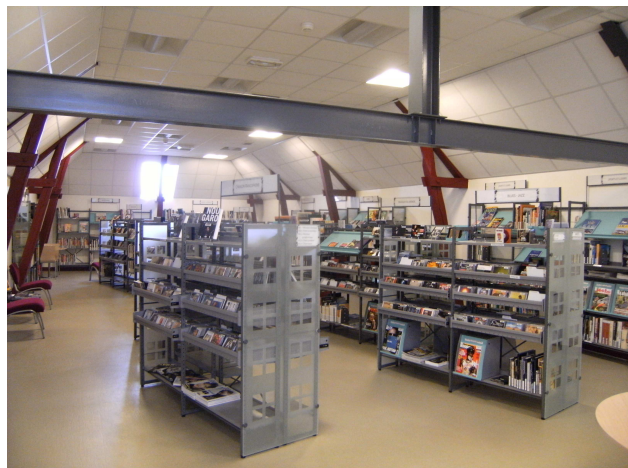
Fig V. Découvertes : L'espace CD / DVD (Pénélope Cornair, Gien 2010)

Le département Découvertes, au deuxième étage également, met ainsi à la disposition des lecteurs des documentaires (de 500 5 à 900 6 , c'est-à-dire histoire, géographie, nature, animaux, art ...) ainsi que les CD, les DVD, un poste informatique en libre accès pour la recherche et la connexion à Internet et une salle de travail où se trouvent les rayonnages dédiés aux encyclopédies.