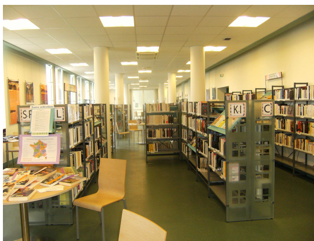
Fig I. Cultures : L'espace Romans (Pénélope Cornair, Gien 2010)

La répartition des collections au sein de l'établissement passe par l'exploitation de trois salles : le département Cultures, au premier étage, accueille la Fiction, la Bande-dessinée et les Livres audio, le tout adulte comme jeunesse.