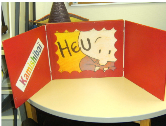
Fig VII. Kamishibai

Le Kamishibai est un petit théâtre traditionnel japonais destiné aux enfants. Dans un cadre en bois, ou en carton fort, sont placées des planches illustrées racontant une histoire. L'animatrice est placée derrière ce cadre et lit le texte correspondant aux images qu'elle fait défiler.