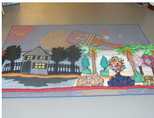
Fig VIII. Raconte-Tapis