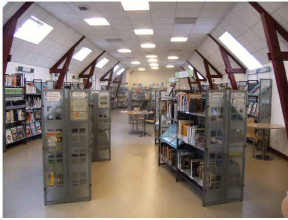
Fig VI. Découvertes : L'espace Documentaires (Pénélope Cornair, Gien 2010)