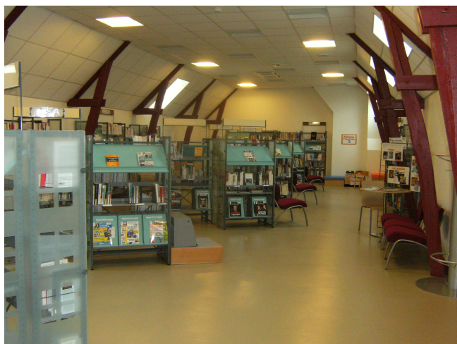
Fig III. Sociétés : L'espace Documentaires (Pénélope Cornair, Gien 2010)

Le département Sociétés, au deuxième étage, accueille les documentaires (de 000 3 à 400 4 , c'est-à-dire informatique, philosophie, psychologie, religion, sociologie, langage, ...) ainsi que les albums et petits romans pour enfants et deux des postes informatiques en libre accès pour la recherche et l'accès Internet.