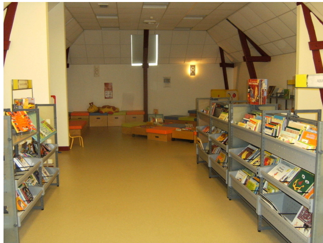
Fig IV. Sociétés : L'espace Petite Enfance (Pénélope Cornair, Gien 2010)

Le département Découvertes, au deuxième étage également, met ainsi à la disposition des lecteurs des documentaires (de 500 5 à 900 6 , c'est-à-dire histoire, géographie, nature, animaux, art ...) ainsi que les CD, les DVD, un poste informatique en libre accès pour la recherche et la connexion à Internet et une salle de travail où se trouvent les rayonnages dédiés aux encyclopédies.