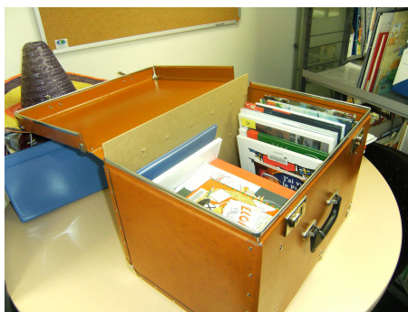
Fig IX. Valise thématique sur Noël (Pénélope Cornair, Gien 2010)

Dans notre bibliothèque, le mot valise n'est pas qu'un terme générique. En effet, les contenants destinés à recevoir la trentaine de documents sont vraiment des valises. En carton fort et bois recouvert de faux cuir, avec poignée et attaches dorées, les valises sont plutôt imposantes et évoquent irrésistiblement les malles de voyages d'un autre siècle. Tous les ouvrages une fois prêts sont installés à l'intérieur de la valise. Les documents d'accompagnement, dûment relus, imprimés et reliés y sont placés également. Il ne reste plus qu'à fermer la valise et à l'identifier au moyen d'une étiquette.