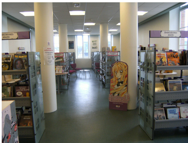
Fig II. Cultures : L'espace BD (Pénélope Cornair, Gien 2010)

Le département Sociétés, au deuxième étage, accueille les documentaires (de 000 3 à 400 4 , c'est-à-dire informatique, philosophie, psychologie, religion, sociologie, langage, ...) ainsi que les albums et petits romans pour enfants et deux des postes informatiques en libre accès pour la recherche et l'accès Internet.