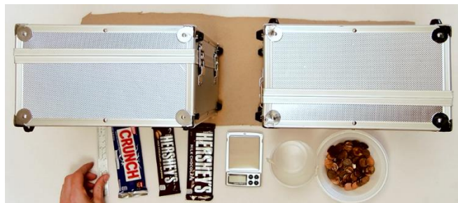
Figure 2 : Présentation de l'expérience

La figure 2 ci-dessous représente l'expérience réalisée dans la vidéo jointe au kit.