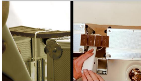
Figure 3 : Approche de la contrainte à la rupture