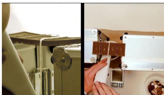
Figure 1 : Résumé de l'expérience

De cette vidéo, on peut tirer l'image suivante pour nous permettre de l'analyser :