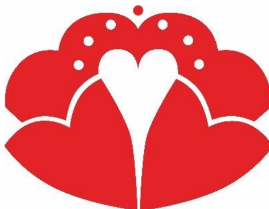
Figure 1 : Logo du festival Coquelicontes