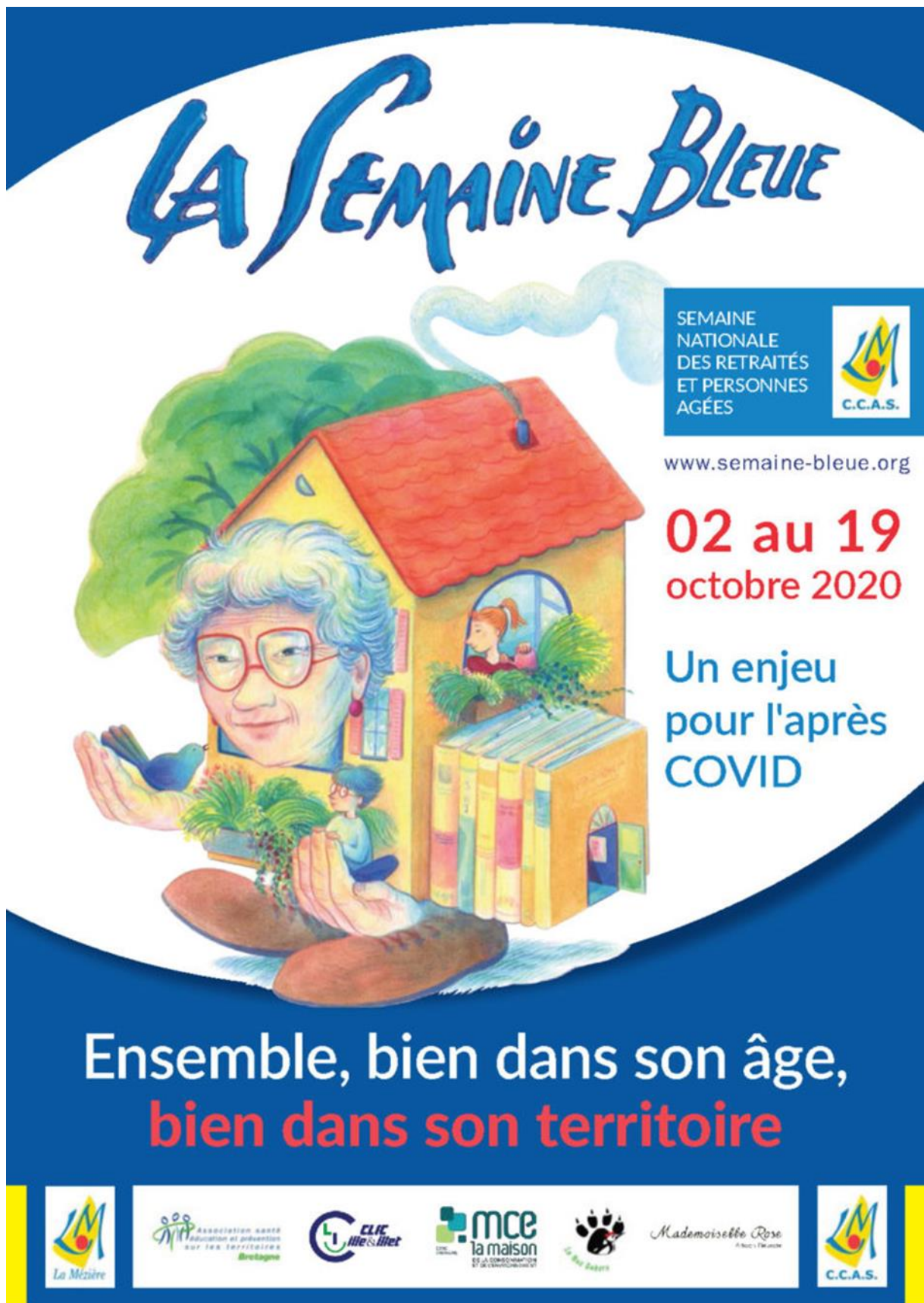
Figure 1 : Affiche de la Semaine Bleue 2020