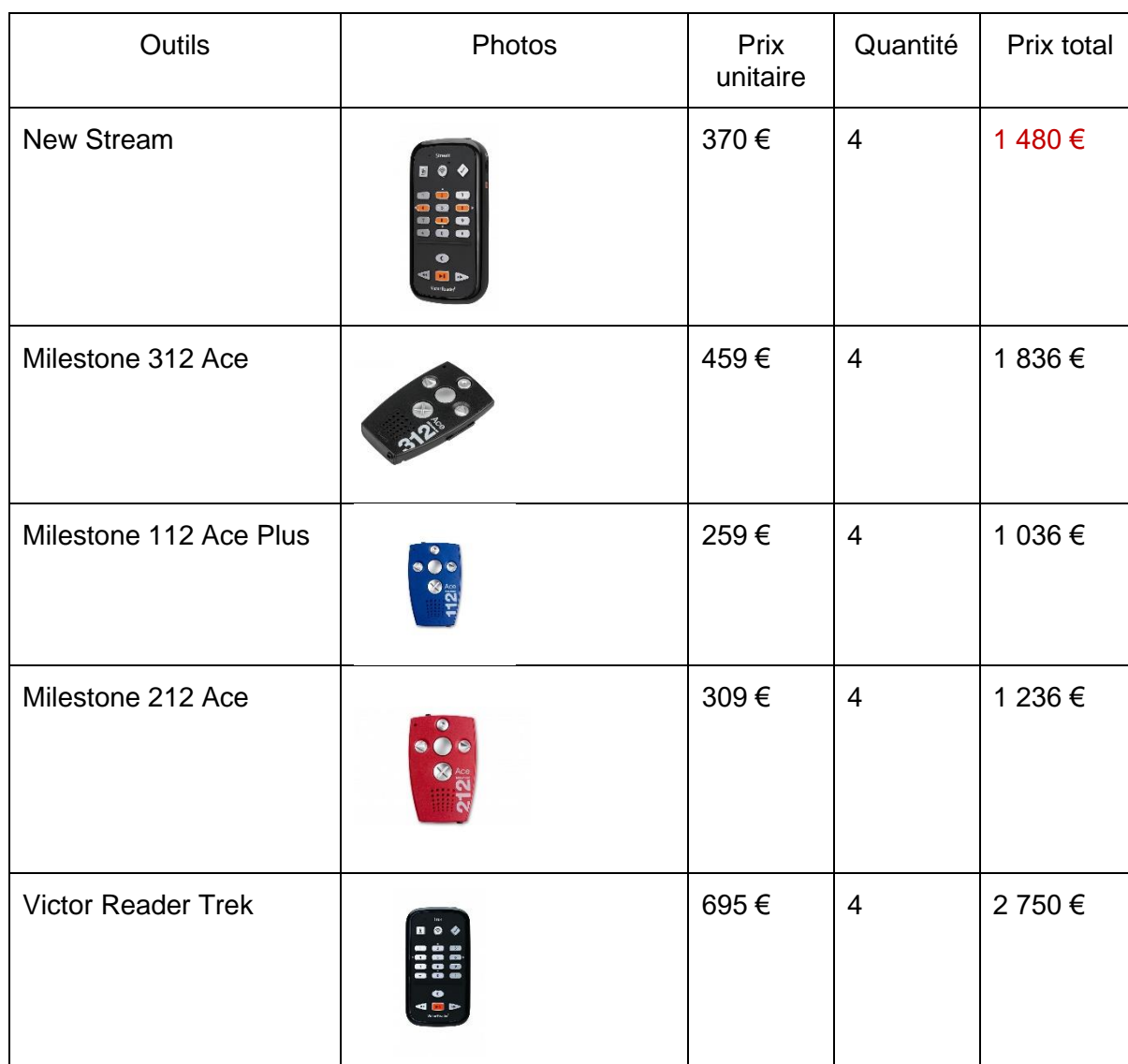
Tableau 3 : Prix des lecteurs de poches DAISY